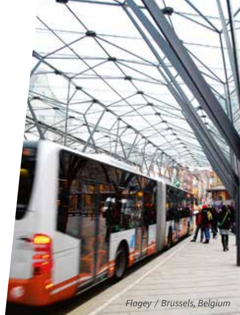
Flagey / Brussels, Belgium

Onze eigen plaatsingsdienst staat garant voor een professionele montage, het onderhoud, eventuele herstellingen en een periodieke controle van uw glasconstructie.