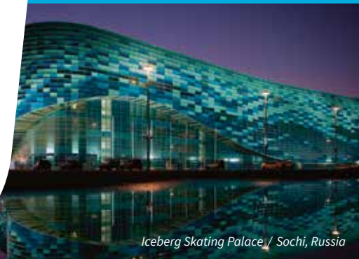
Iceberg Skating Palace / Sochi, Russia

COMPLEXE GLASCONSTRUCTIES DIE INSPIREREN